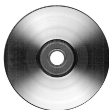
(a) Première sous-légende